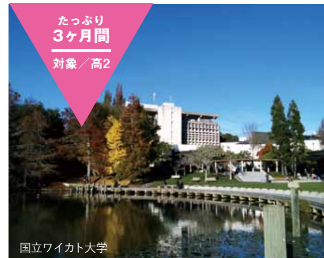
国立ワイカト大学