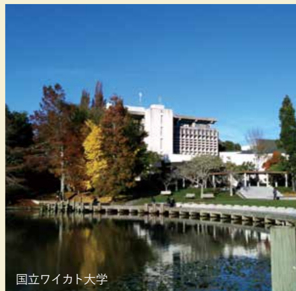
国立ワイカト大学

ニュージーランド語学研修は1997年度にスタートしたプログラムです。25年の間、鹿児島第一から数多くの生徒が参加してきました。オークランド市から南にあるハミルトン市のワイカト大学にあるパスウェイズカレッジでのホームステイでいろんな国々の生徒と一緒に過ごす英語コースです。ホームステイ先から学校に通い、圧倒的な英語量を体験できるプログラムです。